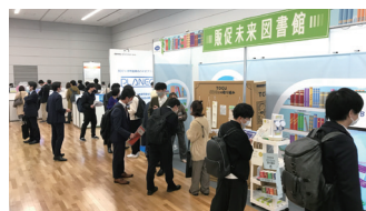
写真 / 第 51 回 JPM 協会展 2022